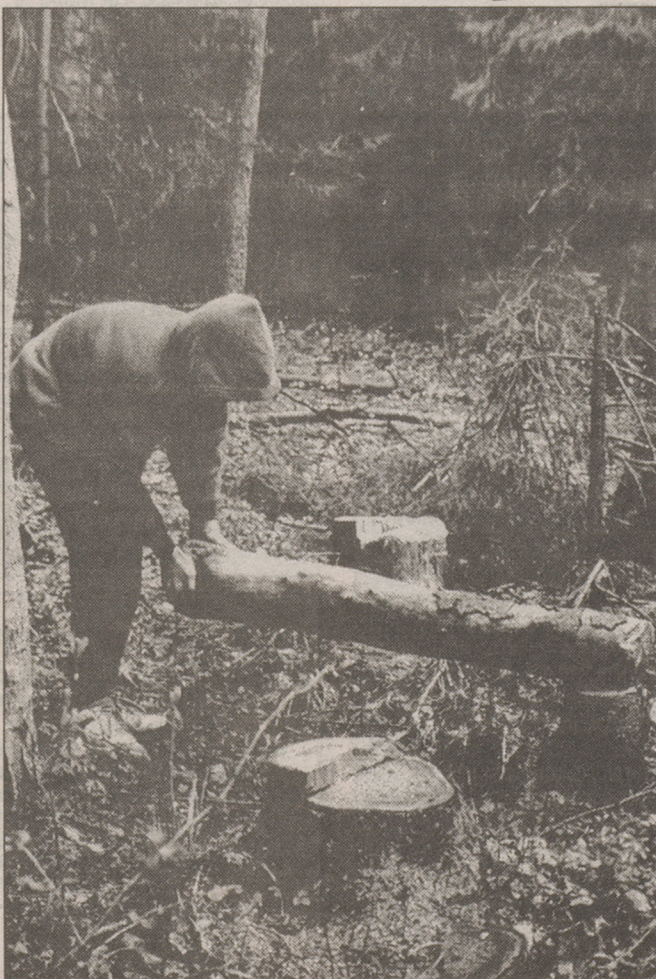
печения сохранности леса, слишком формальные".